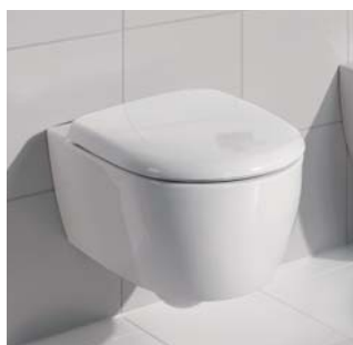
4U 355 x 530 mm, 6 l, Modell-Nr. 203460