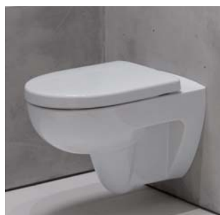
Renova Nr. 1 355 x 540 mm, 4,5/6 l, Modell-Nr. 203050