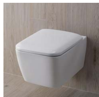
it! 350 x 540 mm, 4,5/6 l, Modell-Nr. 201950