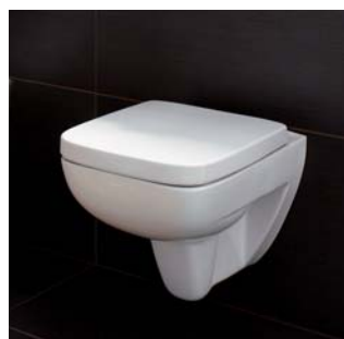
Renova Nr. 1 Plan 355 x 540 mm, 4,5/6 l, Modell-Nr. 202170